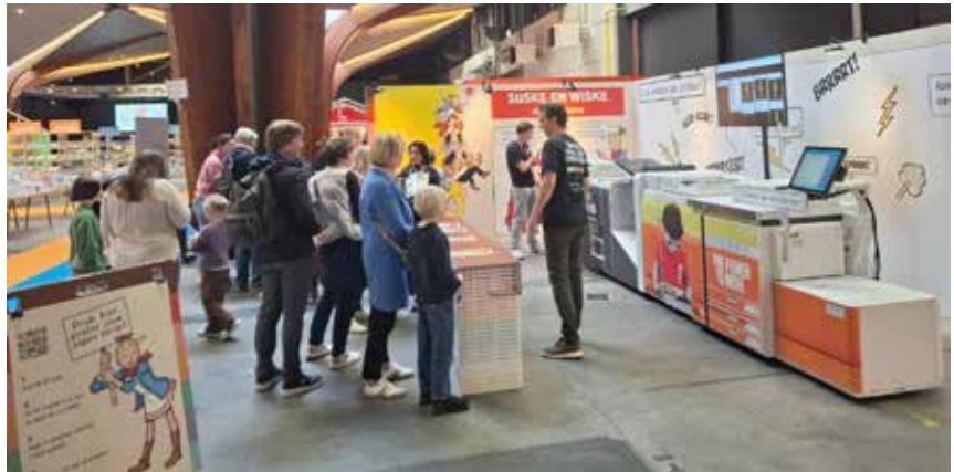
Tijdens de actie van De Indrukmakers op Boektopia werden 8.507 gepersonaliseerde strips geprint

Ook in een digitale wereld kan je met een tastbaar printproduct mensen raken. Dat bewees de succesvolle actie van De Indrukmakers op het boekenevent Boektopia in Kortrijk. Tijdens de negendaagse beurs produceerden De Indrukmakers meer dan 8.500 gepersonaliseerde strips. De boekjes werden geprint op de imagePRESS V700 van Canon.