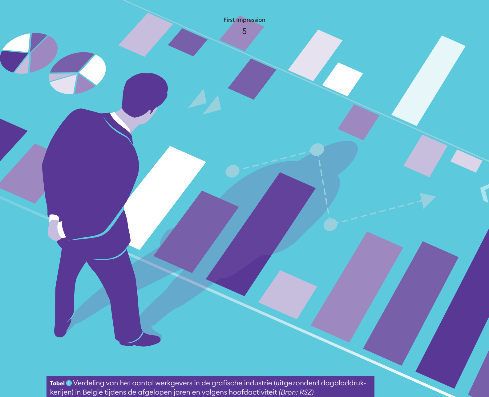
Tabel 1 Verdeling van het aantal werkgevers in de grafische industrie (uitgezonderd dagbladdrukkerijen) in België tijdens de afgelopen jaren en volgens hoofdactiviteit